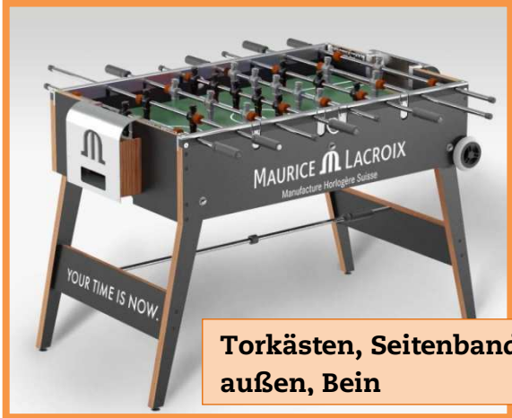
Torkästen, Seitenbande außen, Bein