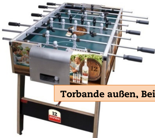
Torbände außen, Bein