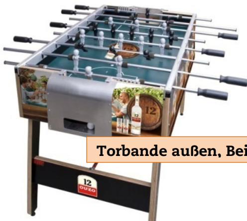
Torbände außen, Bein