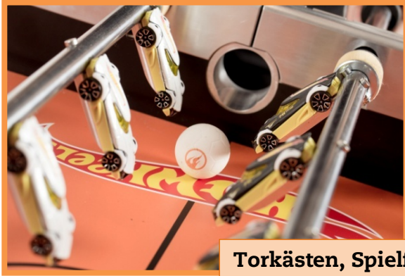
Torkästen, Spielfeld, Figuren, Seitenbande außen, Bein, Korpus-Kanten, Ball